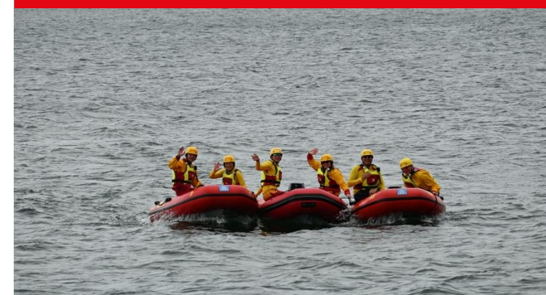
Zentrale Wasserrettungsdienst Küste